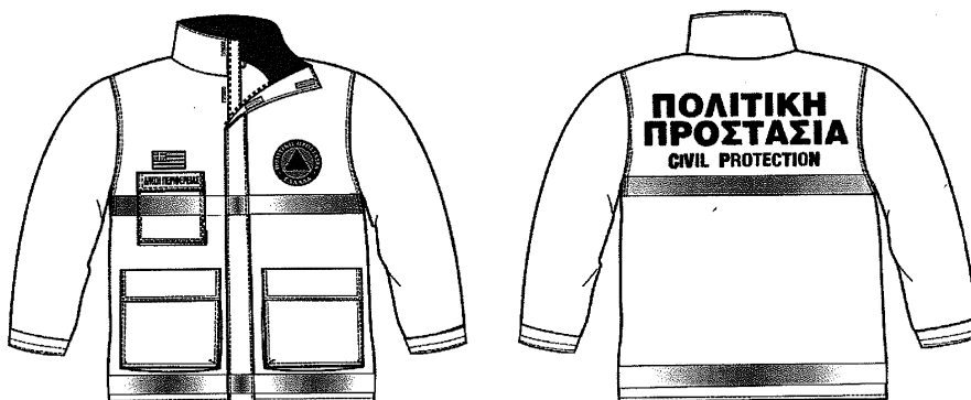
Σχέδιο 1. Επιχειρησιακό μπουφάν Πολιτικής Προστασίας

ΠΡΟΔΙΑΓΡΑΦΕΣ ΕΠΙΧΕΙΡΗΣΙΑΚΟΥ ΜΠΟΥΦΑΝ ΠΟΛΙΤΙΚΗΣ ΠΡΟΣΤΑΣΙΑΣ